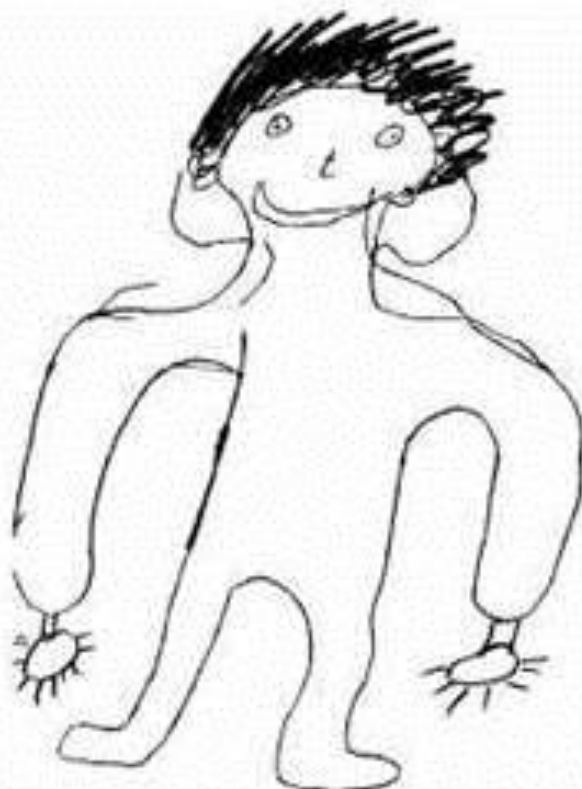
Рис. 144. Выполнен Ярославом В., 9 л. 2 мес. Рисунок человека

34. Практическое задание. Работа с эмпирическими материалами: дайте интерпретацию рисунка человека